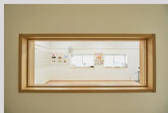
相談室から様子を見れます